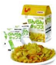
らんらんチップス