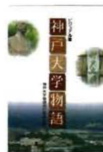
ビジュアル版 神戸大学物語

気軽に楽しく読める神戸大学史「ビジュアル版神戸大学物語」や神戸大学の農場で栽培されたジャガイモを原料とした「らんらんチップス」、農場の柿、産学連携によるお酒「神戸の香」の他、神戸オリジナルグッズを販売いたします。